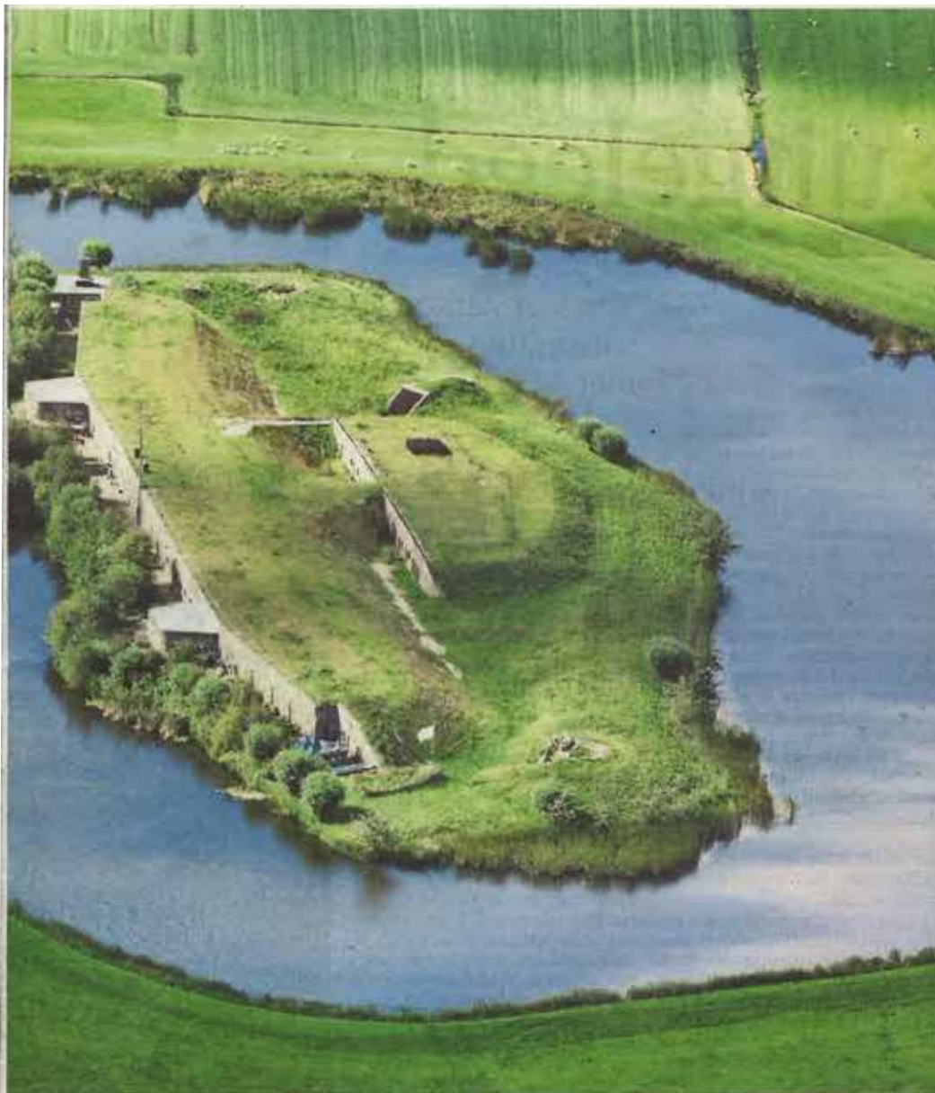
Fort bij Veldhuis, met op de kaartjes links de oprukkende bebouwing (rood) sinds 1960.